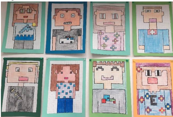
2. Klasse (2. Sem. SJ 24/25)

Der Bildungsrat hat entschieden, dass auf das Schuljahr 2025/26 für alle Klassenlehrpersonen der Volksschule im Kanton St. Gallen eine zweite Entlastungslektion eingeführt wird. Damit erhalten sie mehr Zeit für die anspruchsvollen Aufgaben ausserhalb des Unterrichts. Leider wird diese Massnahme nicht, wie ursprünglich angedacht, kostenneutral umgesetzt. Für Lütisburg bedeutet dies, dass sechs der zehn zusätzlichen Klassenlehrerlektionen durch die Schulgemeinde finanziert werden müssen. Dieser Entscheid wurde erst Anfang Januar 2025 durch den Bildungsrat gefällt und hatte Mehrkosten bei den Löhnen zur Folge. Im Budget 2026 sind diese Kosten erstmals für das ganze Jahr eingerechnet.