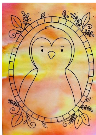
Lian Blaser, Kindergarten A

Die Schulinfrastruktur wurde in den vergangenen Jahren stetig weiterentwickelt. Die Schulanlage Neudorf wurde saniert und erweitert, um aktuellen pädagogischen Anforderungen und steigenden Schülerzahlen gerecht zu werden. Aktuell steht der Ersatzbau der Mehrzweckhalle auf dem Programm. Die erfolgreiche Umsetzung des Projekts ermöglicht einen zeitgemässen Sportunterricht und macht die Schule bereit für kommende Herausforderungen. Schulanlagen bilden eine zentrale Grundlage für die Entwicklung und Entfaltung von Kindern und Jugendlichen. Sie bieten Räume für Lernen, Kreativität, Bewegung und soziale Interaktion. Eine gut geplante und gepflegte Ausstattung ermöglicht nicht nur einen professionellen und funktionalen Schulbetrieb, sondern schafft auch Möglichkeiten für ausserschulische Aktivitäten. Damit leistet sie einen wichtigen Beitrag zur Bildung, Persönlichkeitsentwicklung und Integration der jungen Generation.