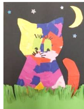
Livia Näf, 1. Klasse a