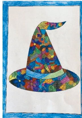
Riana Zuber, 4. Klasse