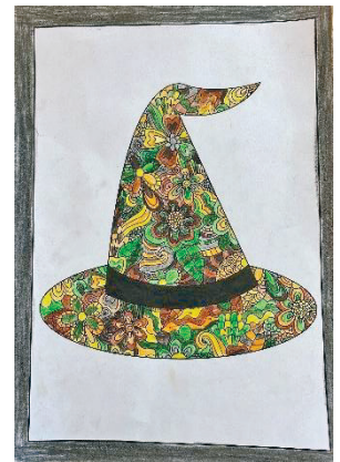
Lily Künzle. 4. Klasse

Für die vakante Stelle in den Tagesstrukturen konnte im August Leslie Ruiz angestellt werden.