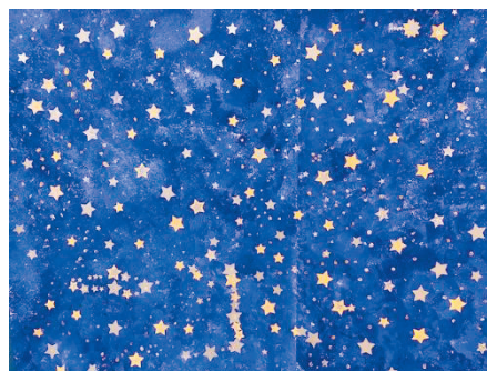
Kindergartenklasse B, Gemeinschaftsbild

Weitere Informationen zum Projekt «Ersatzbau Mehrzweckhalle Lütisburg» finden Sie auf unserer Webseite: https://mzh.schuleluetisburg.ch