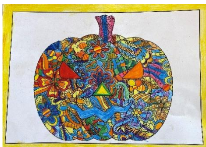
Luca Germann, 4. Klasse