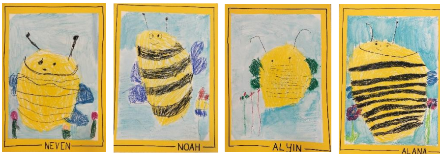
Thema Bienen, Kindergarten C