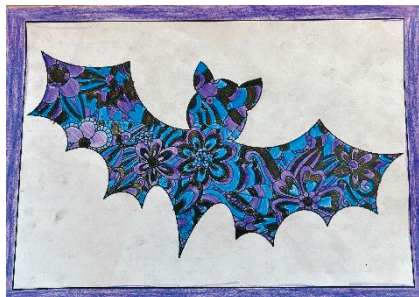
Anina Stillhart. 4. Klasse

Seit August 2025 führen wir die 1. Klasse mit 36 Kindern doppelt. Für die neue Stelle konnten wir mit Livia Lenherr eine Junglehrperson gewinnen. Sie hat im Sommer 2025 die Primarlehrerausbildung an der PH St. Gallen abgeschlossen.