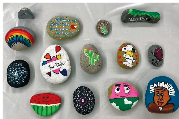
6. Klasse, Glückssteine

Gemeinsam blicken wir zuversichtlich in die Zukunft und sind überzeugt, dass wir auch weiterhin viel Positives für die Entwicklung und Förderung Ihrer Kinder auf den Weg bringen können.