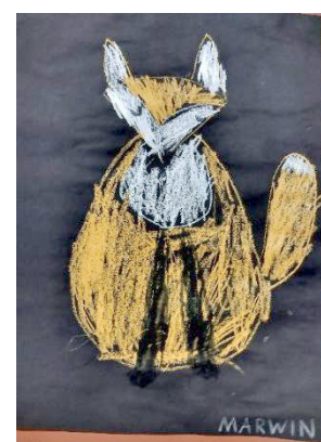
Thema Fuchs, Kindergarten C