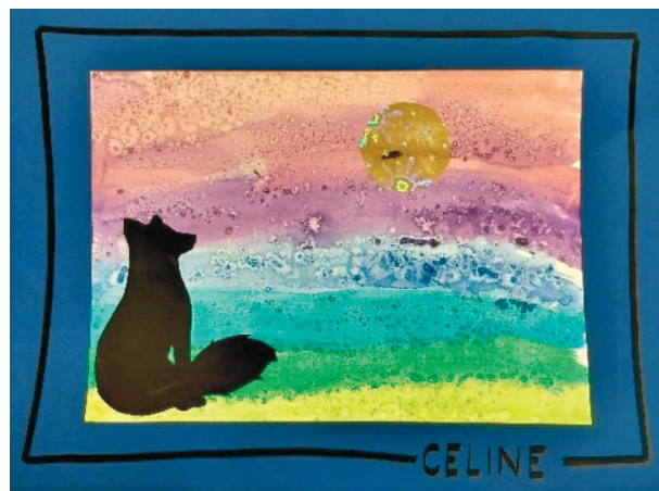
Celine Strassmann, Kindergarten C

Ein Austausch einzelner Lampen mit derselben Technologie wurde als nicht nachhaltig erachtet. Der Schulrat entschied sich deshalb für eine vollständige Umstellung auf eine energieeffiziente und langlebige LED-Beleuchtung.